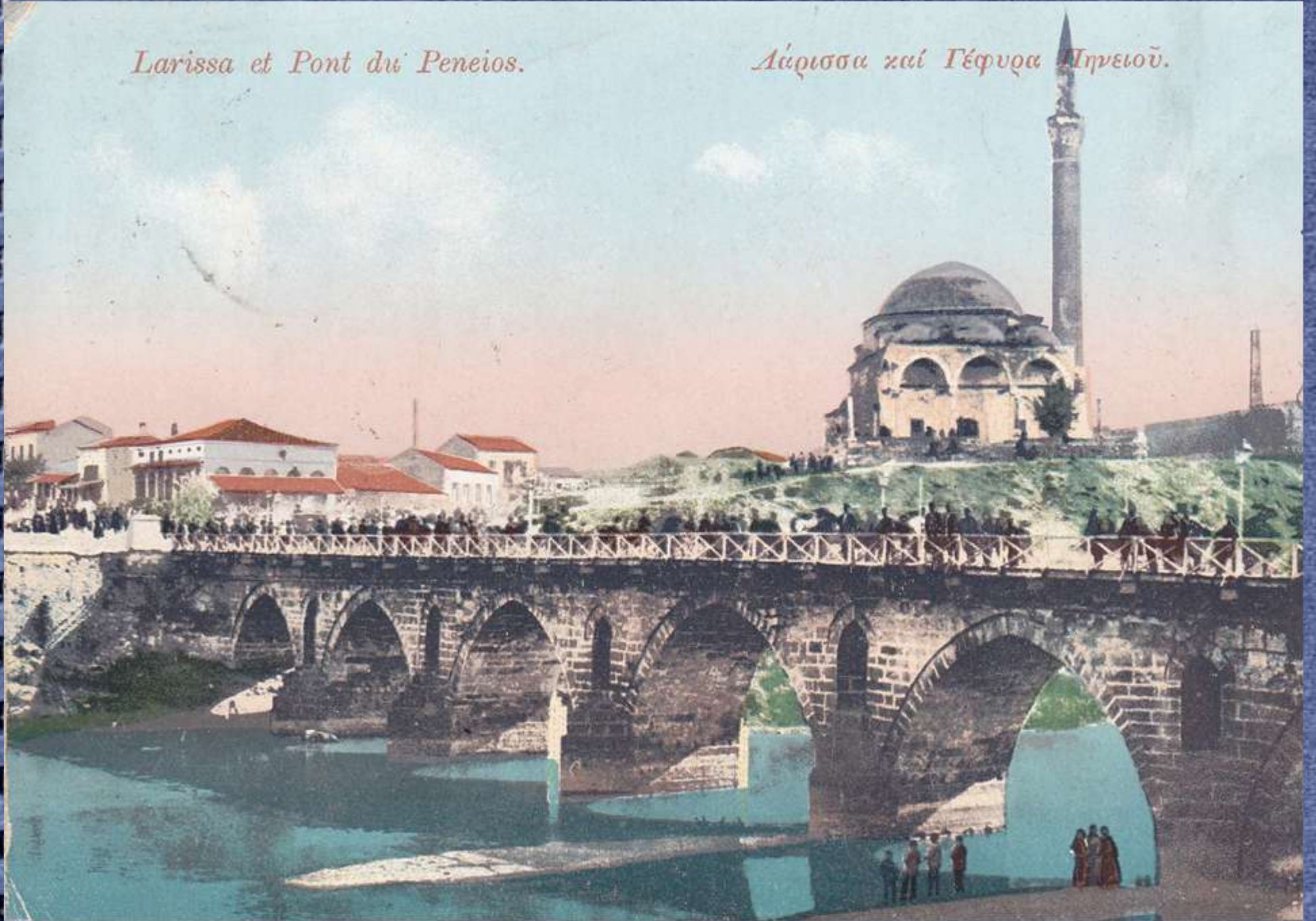
Λάρισα καὶ Γέφυρα Πηνειοῦ.